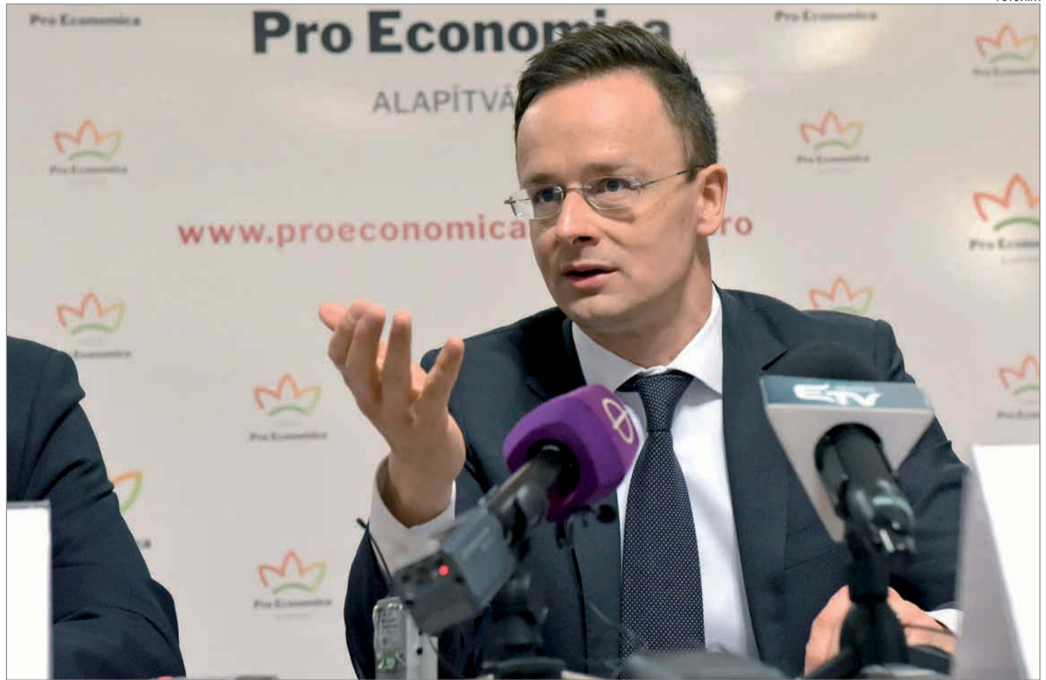
Szijjártó Péter külügyminiszter szerint Liviu Dragnea komolyan veszi az adott szavát, és azt teljesíteni is akarja

nézzük az autópályák és a gyorsvasutak hálózatának sűrűségét a nyugat-, illetve a kelet-európai térség között, akkor óriási különbségeket észlelünk. Ennek történelmi okai vannak, hiszen ez a térség hosszú ideig diktatúra, elnyomás alatt állt, ahol lehetetlenek voltak a nyugatiakhoz hasonló fejlesztések. Ezért nekünk most gyorsabb léptékben kell fejleszteni annak érdekében, hogy behozzuk a lemaradásunkat. A Budapest és Kolozsvar közötti gyorsvasút építése az egész térség fejlesztése szempontjából lényeges, ugyanis ebben a régióban nincsen a nyugat-európai sztenderdek szerinti gyorsvasútnak minősíthető pálya.