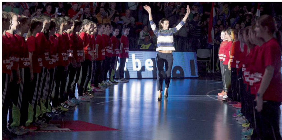
Az est Görbicz Anitáról szólt, aki 233 válogatott mérkőzésén 1111 gólt dobott

szönhetek el tőled. Te vagy a világ legjobb kézilabdázója!”. Felemelő szavak egy szintén világklasszis kézilabdakapustól, aki a szövetség nevében egy 233-as számozású mezt is átnyújtott.