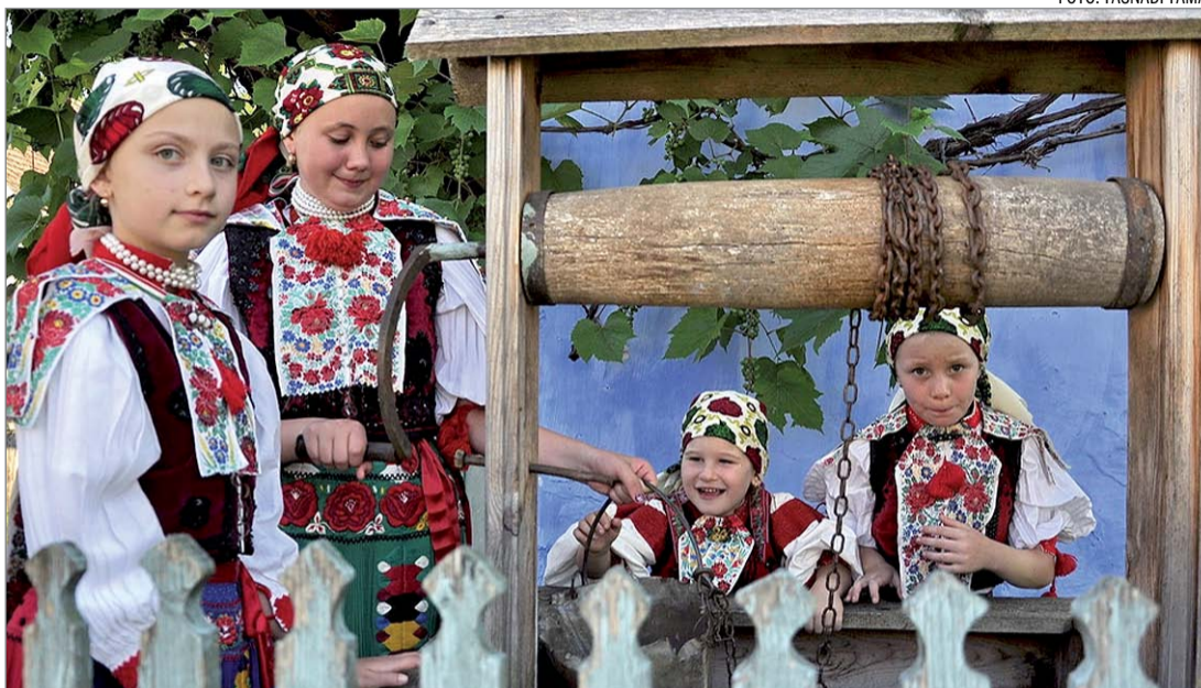
Kalotaszegi lányok a pompás népviseletben

a tojásra. Ez a folyamat napjainkban egyre nagyobb méreteket ölt.”