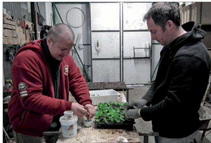
A YouTube-ról tanulták a dugványozás fortélyait