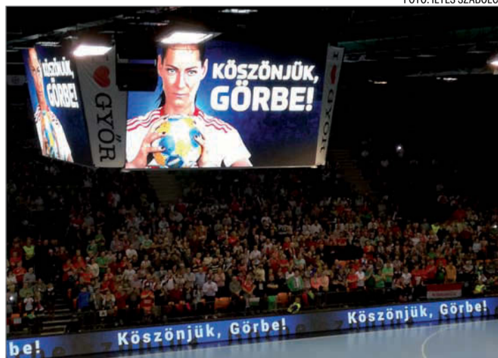
A világ egyik legjobb játékosa vonult vissza a magyar válogatottól

csapatban játszottunk, a sportág királynőjeként köszönsz el a magyar válogatottól. Az 1111 gól önmagában fantasztikus teljesítmény, de én azt az alázatot, győzni akarást emelném ki, ami mindig jellemzett. Egy korszak lezárult, de remélem, még sokáig láthatunk győri színekben. Számomra óriási megtiszteltetés, hogy a szövetség nevében én kö-