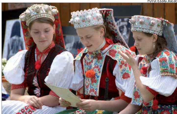
A pártát ma is felteszik Zsobokon

kás. Kalotaszegen azonban – pontosabban néhány Nádas menti faluban – a tojásfestés technikája és motívumkészlete összefonódott a fellendülő bútorfestéssel. Az asztalos- és a bútorfestő-családokban hagyományá vált a hímes tojás ecsettel és bútorfestéssel való festése és egyúttal a bútorra festett minták nagy részének átvitele