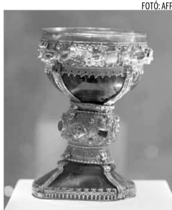
A spanyol léoni Grál

A fantáziadús elméletek listája azonban nem merül ki ennyivel: ugyancsak apokrif megközelítés szerint például a Grált Lucifer koronájának smaragdijából faragták ki, amely akkor esett ki a fejdíszből, miután a bukott angyalok vezérével Isten letaszította a mennyből. Viszont sokan a középkor egyik