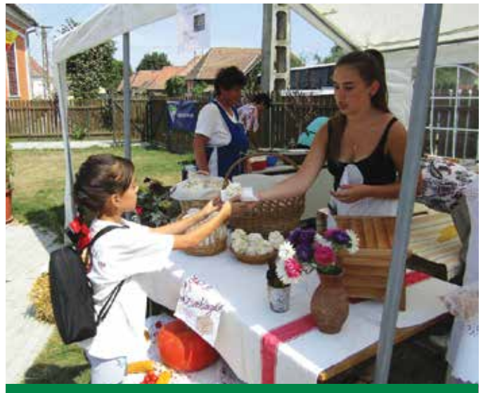
Kelendő a porcukros hólabda

Ezzel egy időben a sportpályán több Maros megyei gazdakör vett részt a gulyásfőző versenyen, amelyet egy helyben összeállított zsűri bíralt el. A zsűri tagjainak nem sikerült győztest választania, de végül abban állapodtak meg, hogy mindegyik csapat nyert.