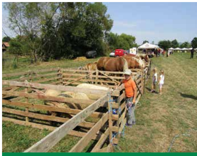
A sportpályán felállított ló- és juhkarám a kisebbeket vonzotta

A szakmai előadásokat a Csűrszínházban tartották meg. Sajnos idén sem telt meg a hatalmas terem, annak ellenére, hogy a szervezők kiváló