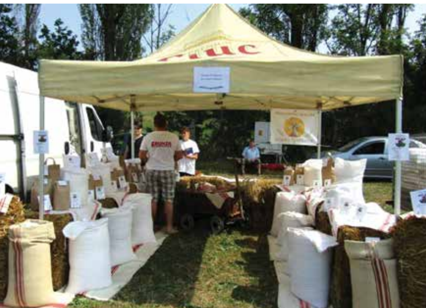
A gylakutai malom is kivonult

Aztán, ahogy a termés csökkent, ugyanők esküdtek az egészségre gyakorolt jótékony hatására. Ugyanez történt például a tojással, vagy a paprikatermesztés terén is volt már rá példa, hogy különböző termékeket mondvacsnált okokkal próbáltak kiszorítani a piacról. Az ilyen jelenségekre is oda kell figyelniük a jövőben mind a gazdáknak, mind a döntéshozóknak – hallhattuk egyebek között a szakmai fórumon.